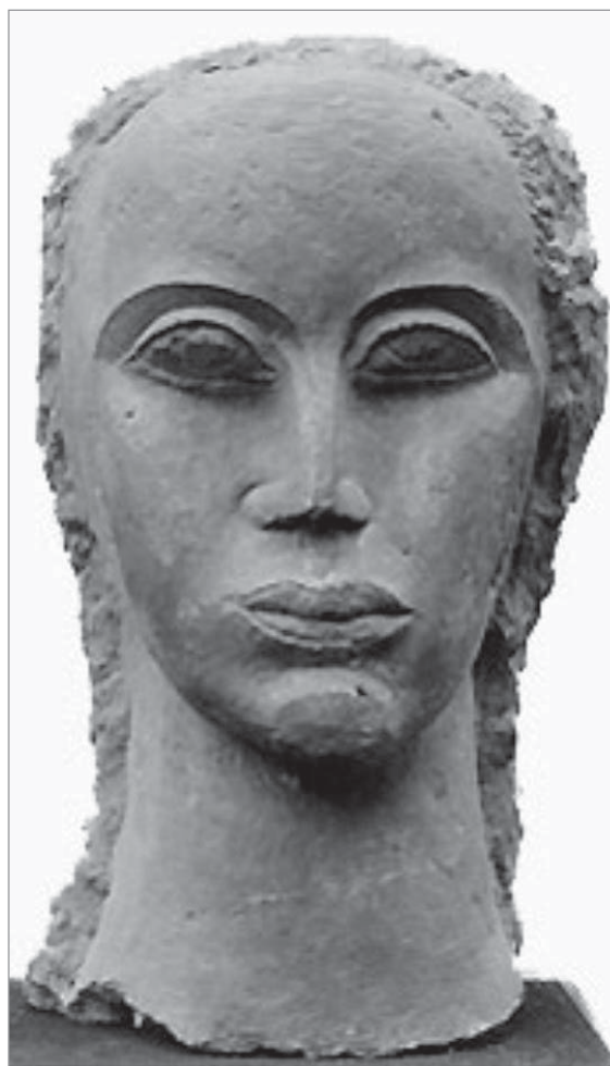
Ossip Zadkine. Portret, teracotă, 1931, Muzeul de Arte Frumoase, San Francisco

Alte publicații din Republica Moldova își fac apariția într-o perioadă destul de târzie – la sfârșitul anilor ’80 ai secolului trecut, fiind scrise de T.Stavilă, publicarea lor tardivă fiind condiționată de restricțiile ideologice ale epocii sovietice, arta basarabeană interbelică făcând parte din “moștenirea burgheză”.