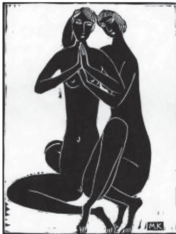
Două nuduri. 1929/30, 25 x 19 cm., linogravură, Salon Gerhard Sohn, Dusseldorf

Un document original cu referire la cunoștințele sculptorului din perioada pariziană târzie se păstrează în colecțiile Muzeului Național de Artă Modernă a Centrului „G. Pompidou”. Este vorba de carnetul de bal „Livre d'or” a Ninei Kandinsky, soția cunoscutului abstracționist, completat în perioada anilor 1928-