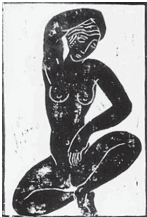
Așteptare. Charlotte Bara, ilustrație, 1919-21, xilografură

Nudul feminin a fost unicul subiect al operelor lui M.Kogan pe care l-a reflectat prin chipuri, lipsite de banalitate, exprimând un model în permanentă perfecționare. A realizat o imagine complexă, consacrată tinereții și valorilor estetice ale secolului