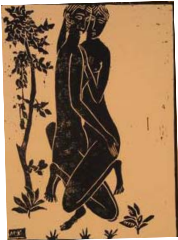
Două nuduri. 1929/30, 25 x 19 cm., linogravură, Montgomery Art Center, San- Francisco

În „Allgemeines Lexikon”, despre studiile