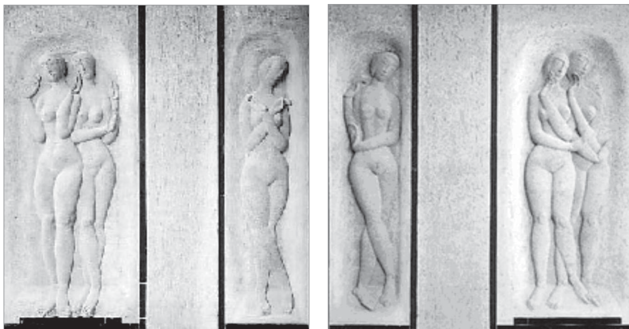
Relief pentru Fabrica de expoziții din Cologne, 1913-14 piatră artificială, 200 x 218 cm.

Interesante sunt preferințele lui M.Kogan în tehnicile pe care le promovează – sculptura în bronz, teracotă, marmură, tapiserie, arta medalieră și grafica. Totodată sunt menționate muzeele, ce dețin în colecțiile sale operele sculptorului – Munchen, Bremen, Folkwang din Essen, Hamburg,